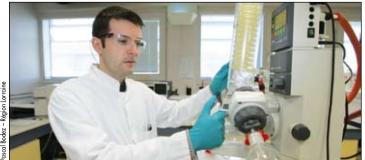
La Région Lorraine soutient le projet Bioprolor, dédié à la filière bio-thérapeutique.